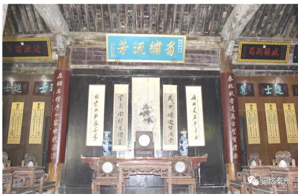
黄桥何氏宗祠大厅

黄桥镇的珠巷长约350米，历史上珠巷称猪巷，巷道两侧多是猪行，后来猪行外迁，取而代之的是各式商铺。人们逐渐将猪巷改称珠巷，1921